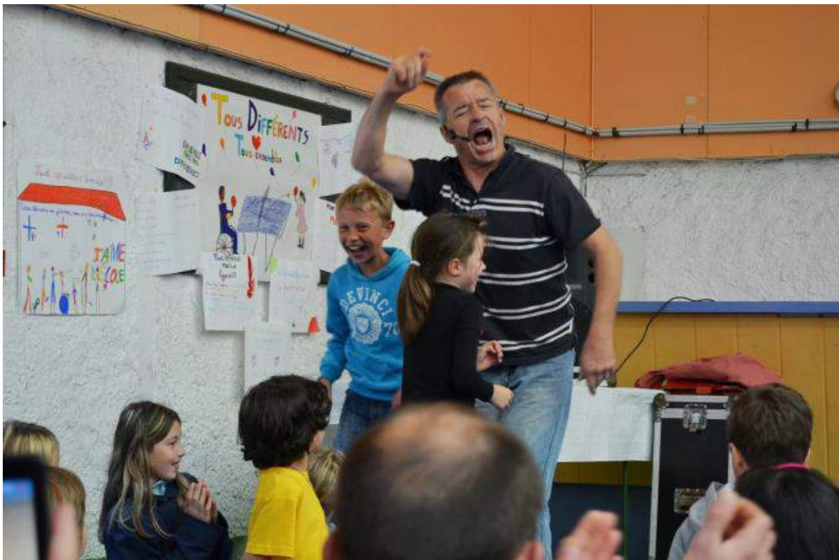
L'interactivité comme mot d'ordre...des jeux, des rires, des mises en situation de handicap

Spectacle adapté aux grandes sections, CP et CE1