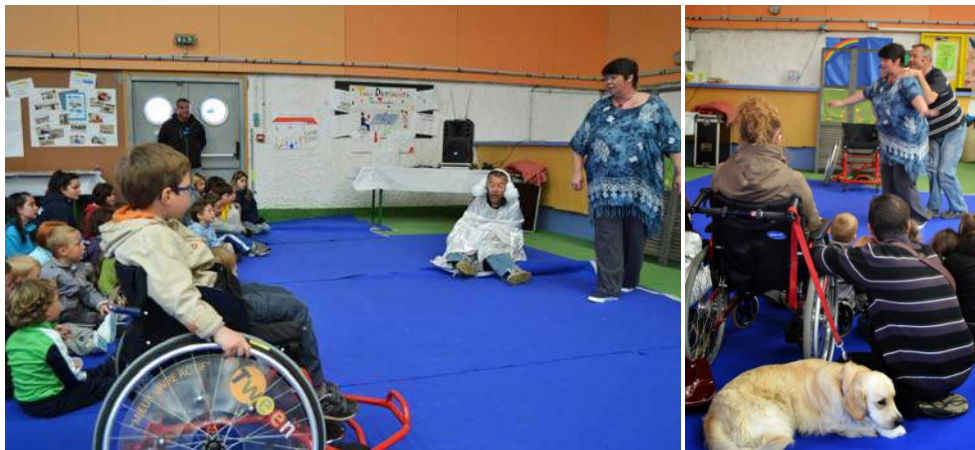
Sur ces deux photos...partie contes : « le petit flocon tout bizarre » et « l'enfant qui voulait devenir danseur »

Pour ce faire, nous construisons des ateliers sur des situations concrètes du quotidien, afin que les enfants puissent garder des repères face aux situations exposées. Tout ce travail est réalisé par deux animateurs, (et, dans le cadre des animations scolaires, en étroite et active collaboration avec les enseignants porteurs du projet qui nous accueilleront dans leur classe)