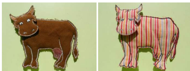
la vache Marguerite : avant et après le passage sous l'arc en ciel