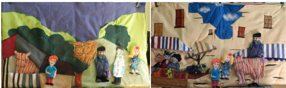
le tapis conte « La vache multicolore » - conte mis en scène pour cycle 2 et 3

A noter...une nouveauté depuis septembre 2013... le tapis conte ! Un support adapté pour le spectacle cycle 2 ET cycle 3 (Spectacle cycle 3 : « conte et raconte la différence aux jeunes matelots ») Un support ludique et coloré ....pour en savoir plus sur le tapis conte cliquez ici .